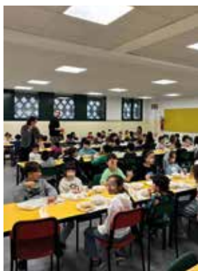
Colazione a scuola