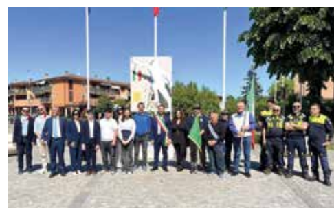
Celebrazione 25 aprile