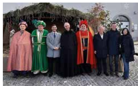
Lancio della Befana e arrivo dei Re Magi