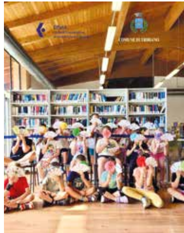
Laboratori in Biblioteca