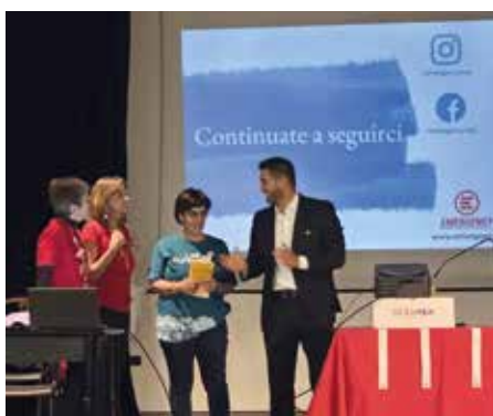
Evento in ricordo di Gino Strada