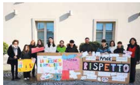
Progetto consiglio comunale dei ragazzi